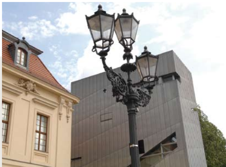
Jüdisches Museum Berlin