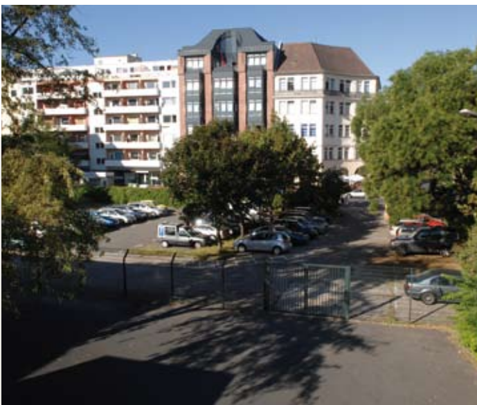
An der Friedrichstraße; eines der zukünftigen Baufelder

Die Vermarktung erfolgt durch den Liegenschaftsfonds Berlin im Rahmen eines bedingungsfreien Bieterverfahrens, das voraussichtlich im ersten Quartal 2010 beginnen wird.