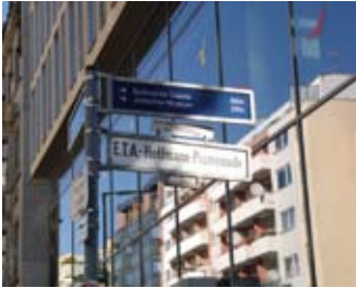
Blick auf die Ärztekammer Berlin

Der Berliner Blumengroßmarkt in der »Südlichen Friedrichstadt« ist den meisten Berlinern gut bekannt. Voraussichtlich 2010 wird der Blumengroßmarkt sein neues Domizil in der Beusselstraße beziehen, so dass sich mitten in Berlins Zentrum völlig neue Perspektiven der Bebauung und Nutzung ergeben.