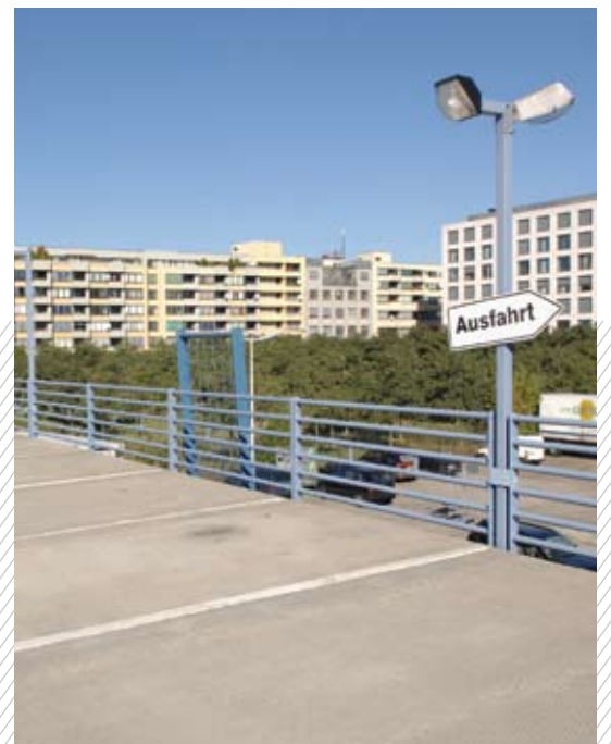
Blick auf Baufeld 2 (MI), entlang Besselpark